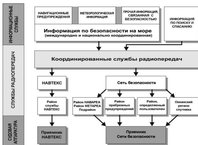
Рис.1. Организация службы ИБМ ГМССБ